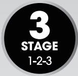
Cook, Drain, Steam