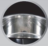
304 Food Grade Stainless Steel Pot