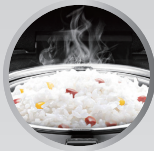
Firm, Grainy Texture Everytime