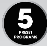
Rice, Steam, Reheat Porridge & Soup

Maestoso Low Carbo Rice Cooker ini dapat membantu menurunkan kadar karbohidrat pada nasi anda sampai 40%. Sangat cocok buat anda yang ingin menjaga kesehatan!!