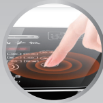
Touch Sensor Control Panel