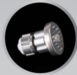
Patented Filter Valve